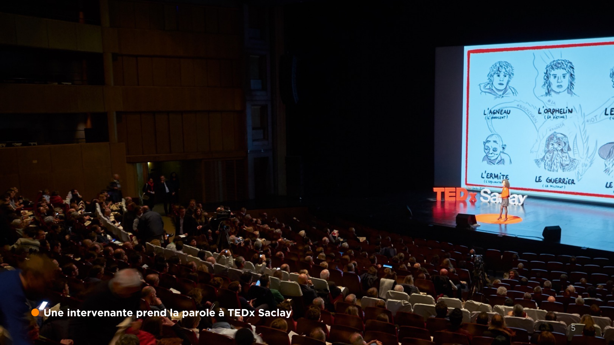
● Une intervenante prend la parole à TEDx Saclay