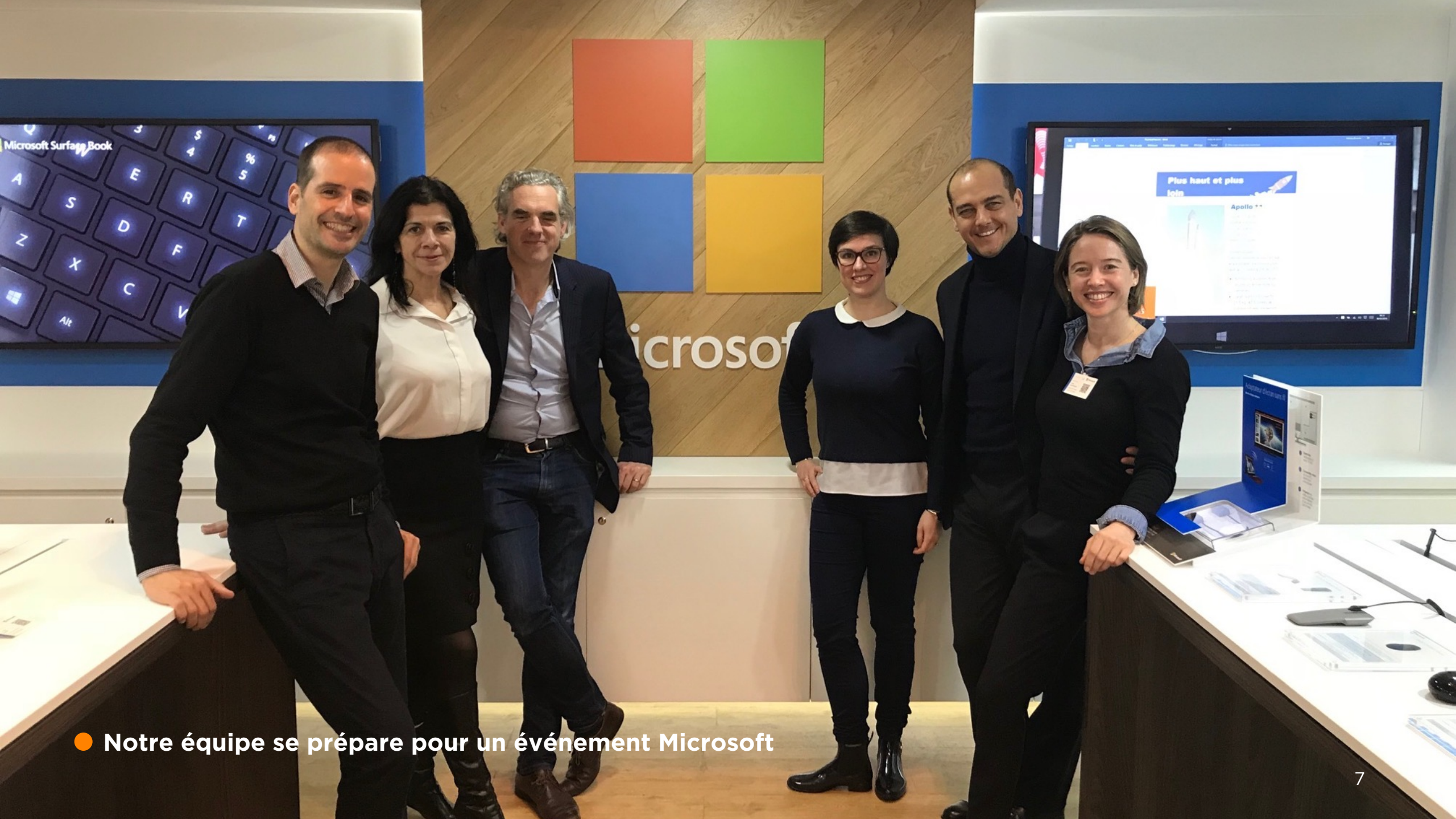
● Notre équipe se prépare pour un événement Microsoft